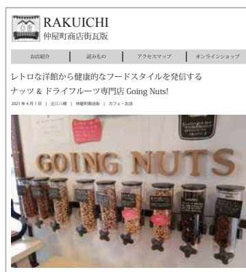
ウェブメディア構築