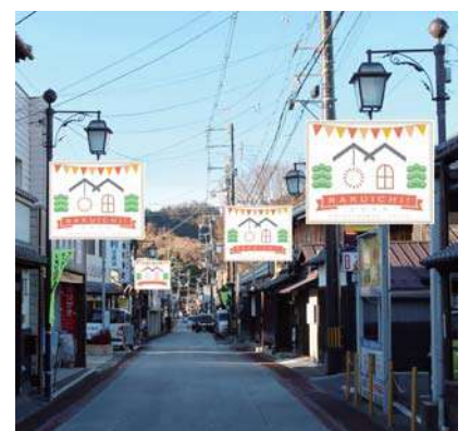
街頭サインフラッグ設置